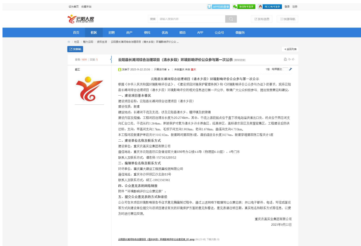
第一次网络公示截图