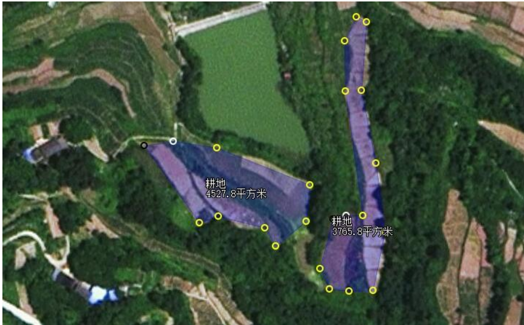
图 5- 3 水源地集雨区农业面源调查情况