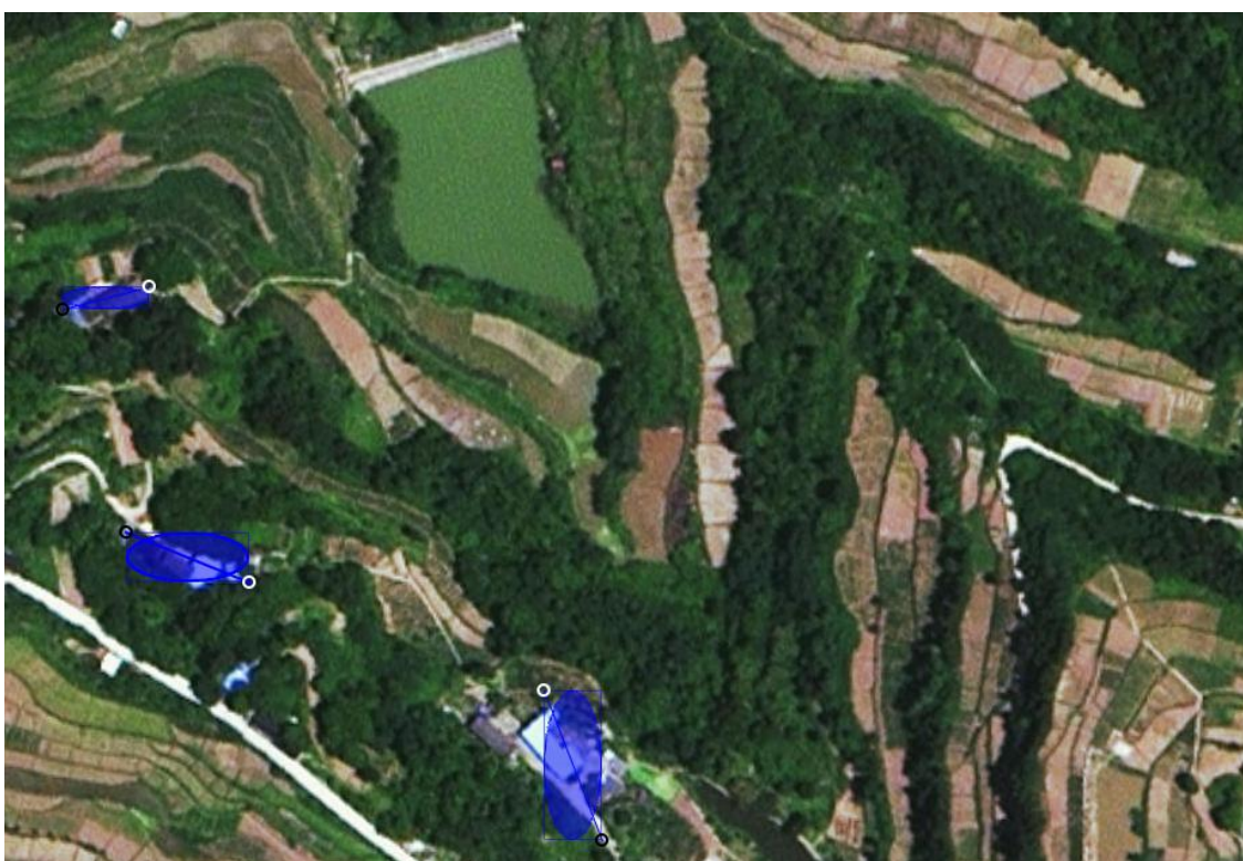
图 5- 1 水库附近分散农户位置图