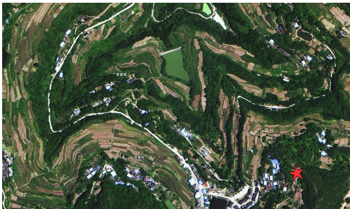
图 3- 1 宝坪镇落幽湾水库水磨水厂影像图

宝坪镇落幽湾水库水磨水厂原服务人口约4100人，日供水量约160t；水源地已于2020年完成规范化建设，设立标识标牌12块，隔离防护网390米。自2016年起，宝坪水库集中式饮用水水源地水源充足，且实现了宝坪镇朝阳社区至水磨社区一体化管网工程全覆盖，基本能保证我镇居民安全饮水，不再从落幽湾水库集中式饮用水水源地取水，现水磨水厂已停用。