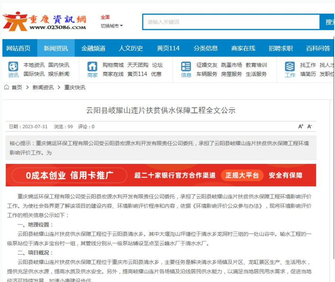
图 6-1 全文公示网站截图