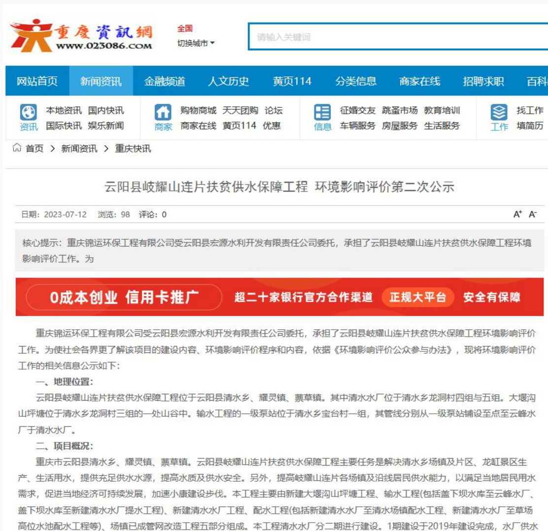
图 3-1 第二次公示网站截图

建设单位在进行第二次网上公示期间，在工程建设所在驻地进行了张贴了环评影响评价信息公告。