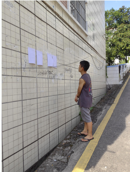
图 3-2 现场张贴公示