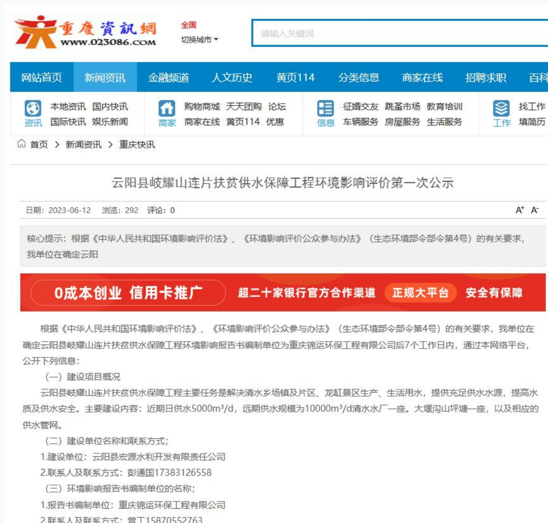
图 2-1 第一次公示网站截图